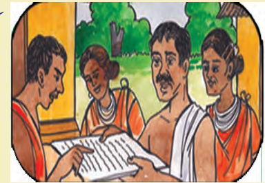
(୧୦) ମିଳିତ ବୈଠକ ନିମନ୍ତେ ପାର୍ଶ୍ୱବର୍ତ୍ତୀ ଜଙ୍ଗଲ ଅଧିକାର କମିଟିମାନଙ୍କୁ ଚିଠି ପ୍ରଦାନ