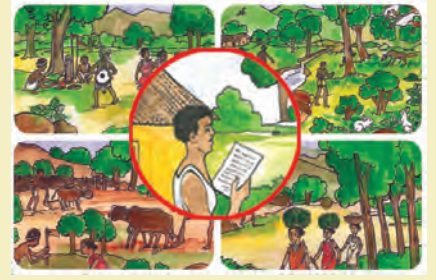
(୧) ଗ୍ରାମ ପଞ୍ଚାୟତର ଚିଠି ମାଧ୍ୟମରେ ଗୋଷ୍ଠିଗତ ଏବଂ ଗୋଷ୍ଠୀ ଜଙ୍ଗଲ ସମ୍ବଳ ଅଧିକାରର ନିର୍ଣ୍ଣୟ ନିମନ୍ତେ ଗ୍ରାମସଭା ଆହ୍ୱାନ