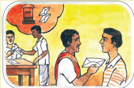
(୭) ଦାବି ଏବଂ ପ୍ରମାଣପତ୍ରର ଯାଞ୍ଚ ନିମନ୍ତେ ଜଙ୍ଗଲ ଏବଂ ରାଜସ୍ୱ ଅଧିକାରୀମାନଙ୍କୁ ପତ୍ର ପ୍ରଦାନ