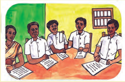
(୧୧) ଜିଲ୍ଲାସ୍ତରୀୟ କମିଟି ଦ୍ୱାରା ଦାବି ଅନୁମୋଦନ ଏବଂ ଶିରୋନାମା ପ୍ରସ୍ତୁତି