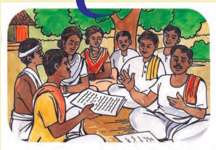
(୯) ଗ୍ରାମ ସଭାରେ ଯାଞ୍ଚ କିରଣା ଉପସମ୍ପାଦନ, ବିଚାରବିମର୍ଶ ଓ ଅନୁମୋଦନ