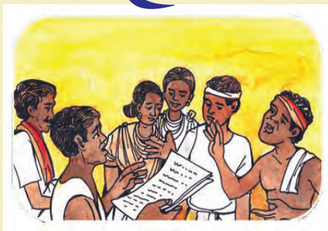
(୮) ଦାବି ଉପରେ ନିଷ୍ପତ୍ତି ଗ୍ରହଣ ଏବଂ ଅନୁମୋଦନ ନିମନ୍ତେ ଗ୍ରାମସଭା ବୈଠକ ନିମନ୍ତେ ଗ୍ରାମପଞ୍ଚାୟତ ତରଫରୁ ନୋଟିସ୍