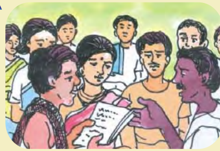
(୫) ଦାବି ଉପରେ ନିଷ୍ପତ୍ତି ଗ୍ରହଣ ନିମନ୍ତେ ଜଙ୍ଗଲ ଅଧିକାର କମିଟିମାନଙ୍କର ମିଳିତ ବୈଠକ