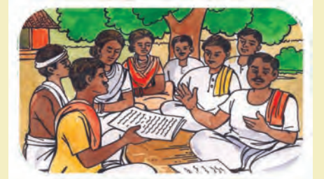
(୨) ଗ୍ରାମସଭାରେ ବିଚାର ବିମର୍ଶ କରାଯାଇ ଗୋଷ୍ଠିଗତ (ଫର୍ମ 'ଖ') ଏବଂ ଗୋଷ୍ଠୀ ଜଙ୍ଗଲ ସମ୍ବଳ (ଫର୍ମ 'ଗ')ର ଦାବି ଫର୍ମ ପୂରଣ