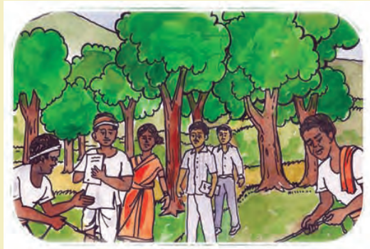
(୬) ସମ୍ବଳ ଅଧିକାରୀଙ୍କ ଉପସ୍ଥିତିରେ ଦାବିପତ୍ର, ନକ୍ସା ଏବଂ ପ୍ରମାଣପତ୍ରର ଯାଞ୍ଚ ଏବଂ ବିବରଣୀ ପ୍ରସ୍ତୁତି