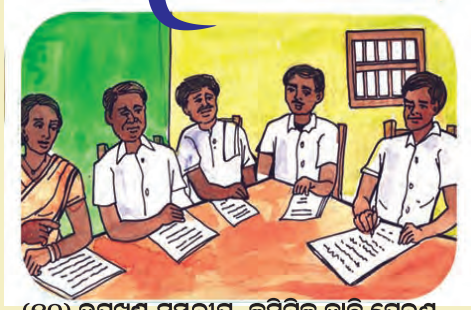
(୧୦) ଉପଖଣ୍ଡ ସମ୍ବଳର କମିଟିକୁ ଦାବି ପ୍ରେରଣ ଏବଂ ଦାବି ଅନୁମୋଦନ