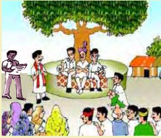
(୧୨) ଗୋଷ୍ଠିଗତ ଏବଂ ଗୋଷ୍ଠୀ ଜଙ୍ଗଲ ସମ୍ବଳ ଅଧିକାରର ଶିରୋନାମା ପ୍ରଦାନ